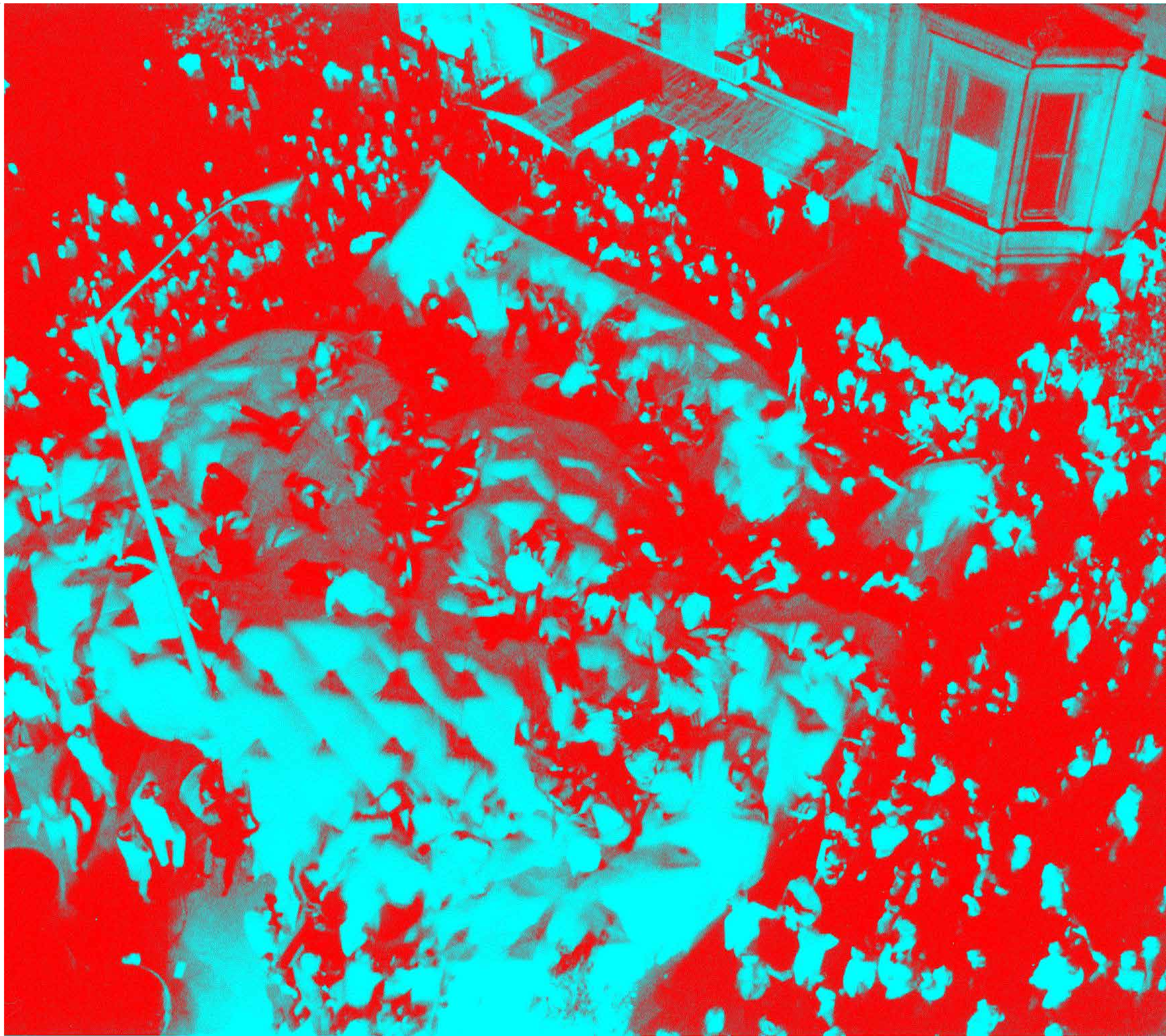
Haus-Rucker-Co, Giant Billboard , New York, 1970