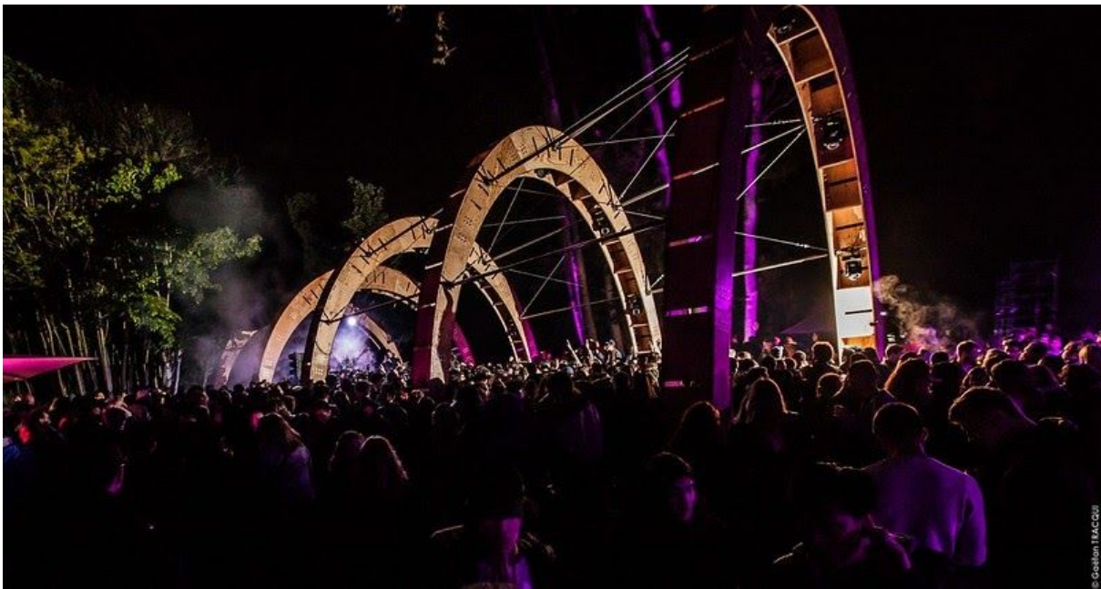
Les Arches de La Clairière, Domaine de Longchamps - Paris. Projet mené avec T/E/S/S