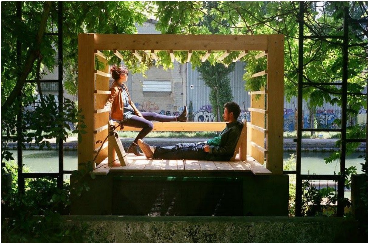
Superstock, Bobigny, Projet mené avec les étudiants du festival Bellastock 2016