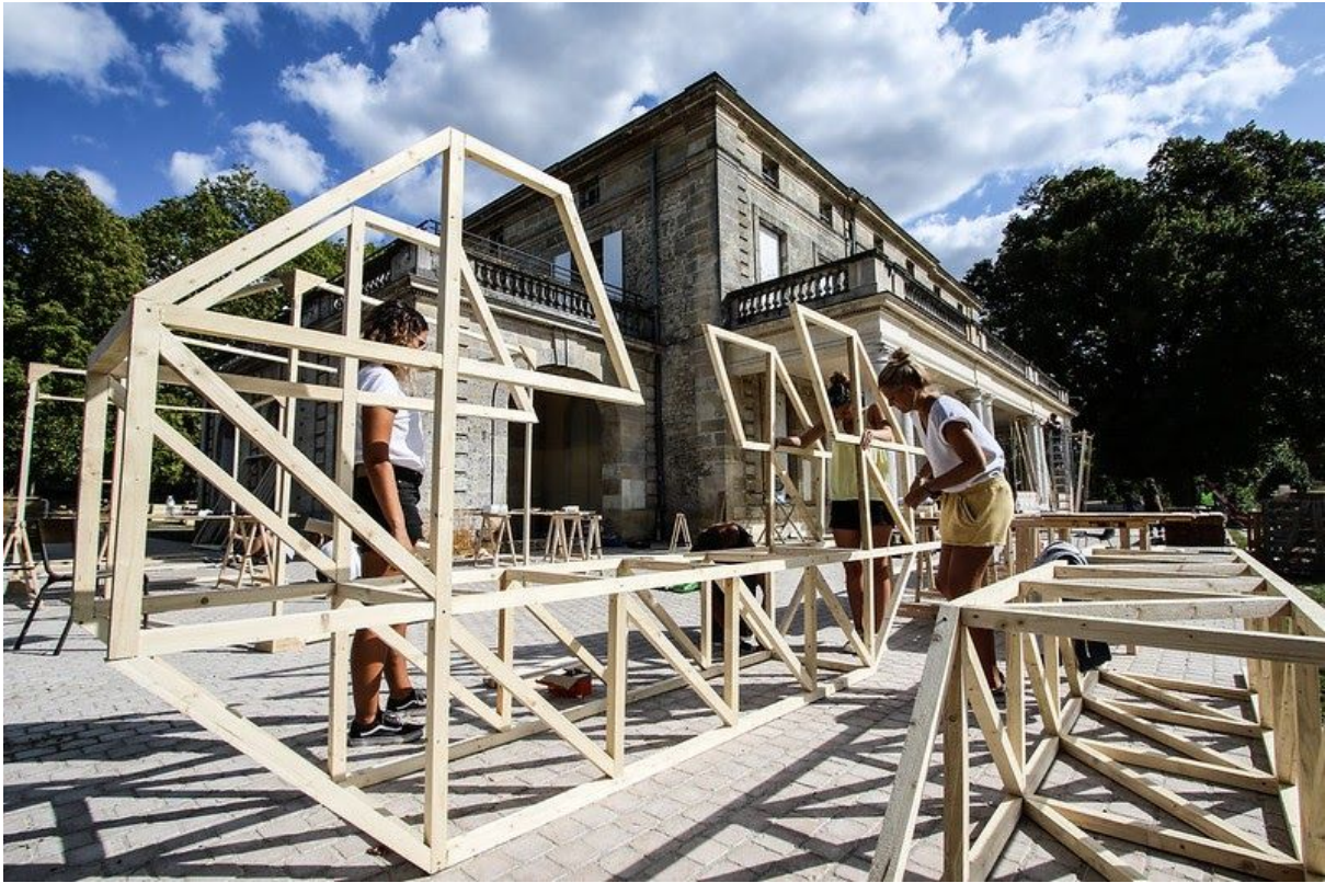
Festival Climax, Bordeaux, projets menés avec de jeunes diplômé.e.s architectes et designers. 2017