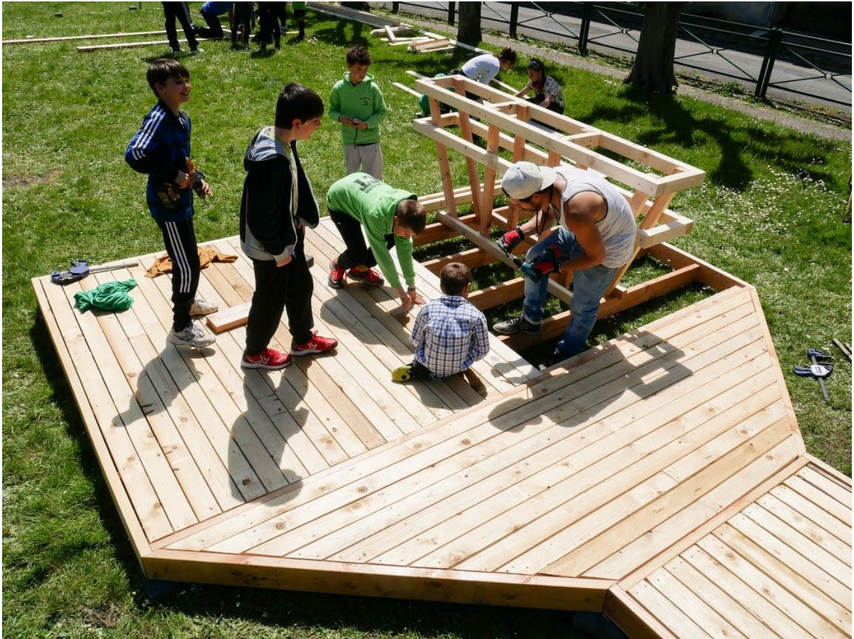
Fontenay-les-Briis, projet mené avec les écoles de la commune, 2018