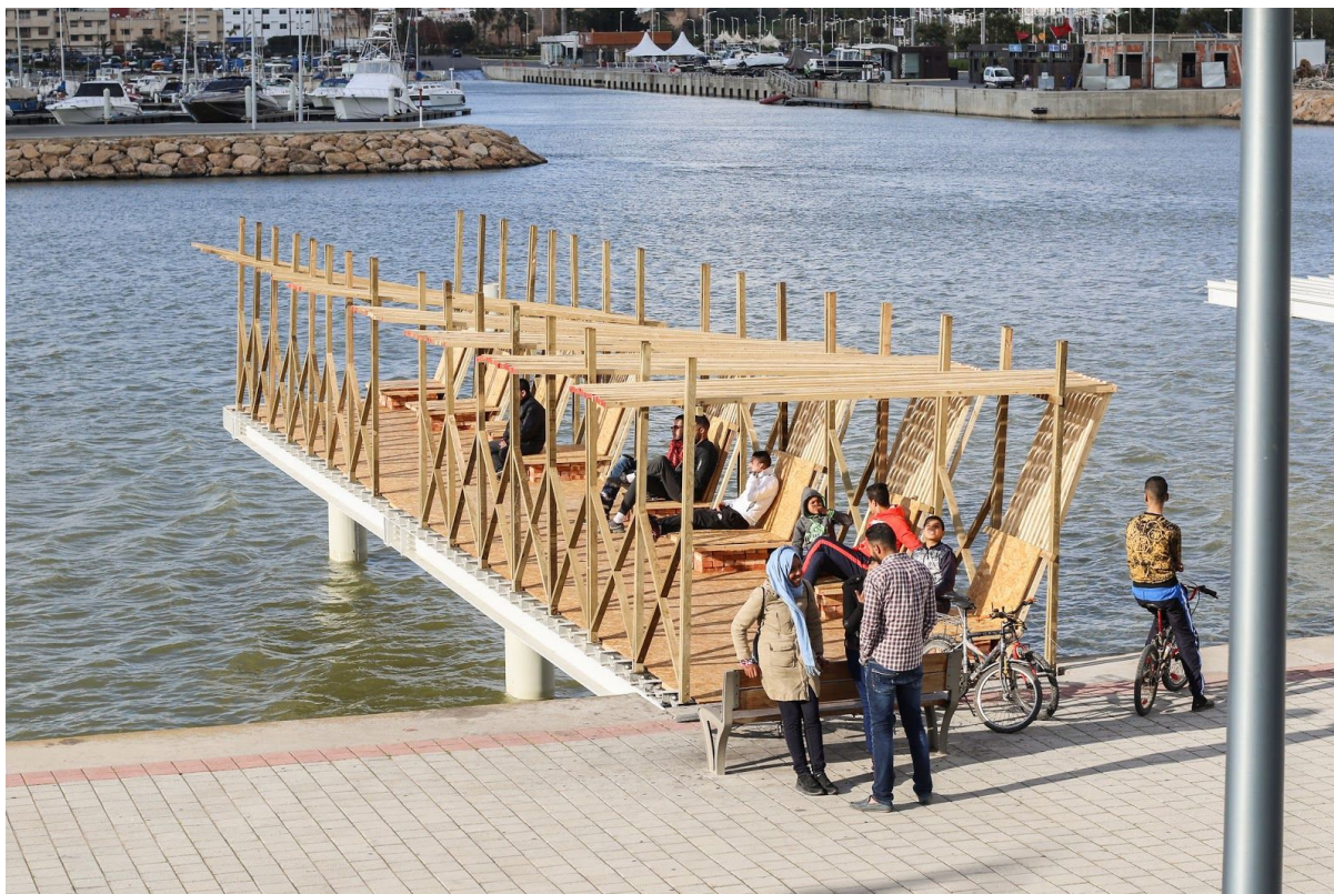
Rabat, Maroc, 2018. Projet mené avec les étudiants de l'école d'architecture de Rabat.