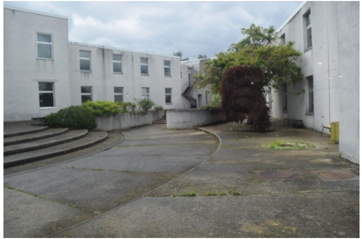
la cour extérieure